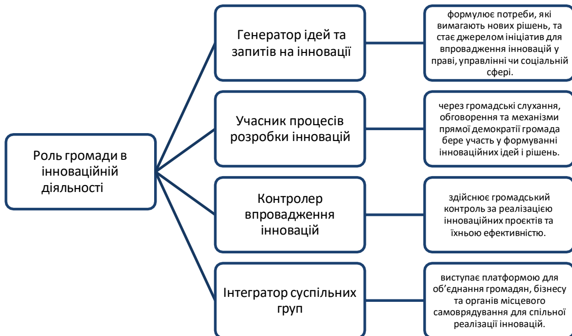
Рис. 1. Роль громади в інноваційній діяльності